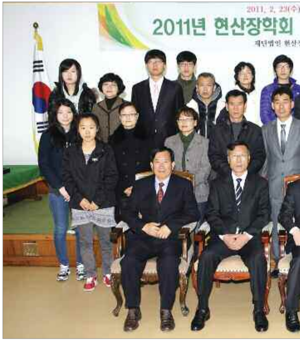
2011년도 현산장학회 장학금 수여식

현산장학회 장학증서 수여식이 23일 오전 군청 대회의실에서 가운데 대학생 15명에게 150만원, 고등학생 8명에게 100만원의 장학금을 수여하는 역할을 해오고 있다.