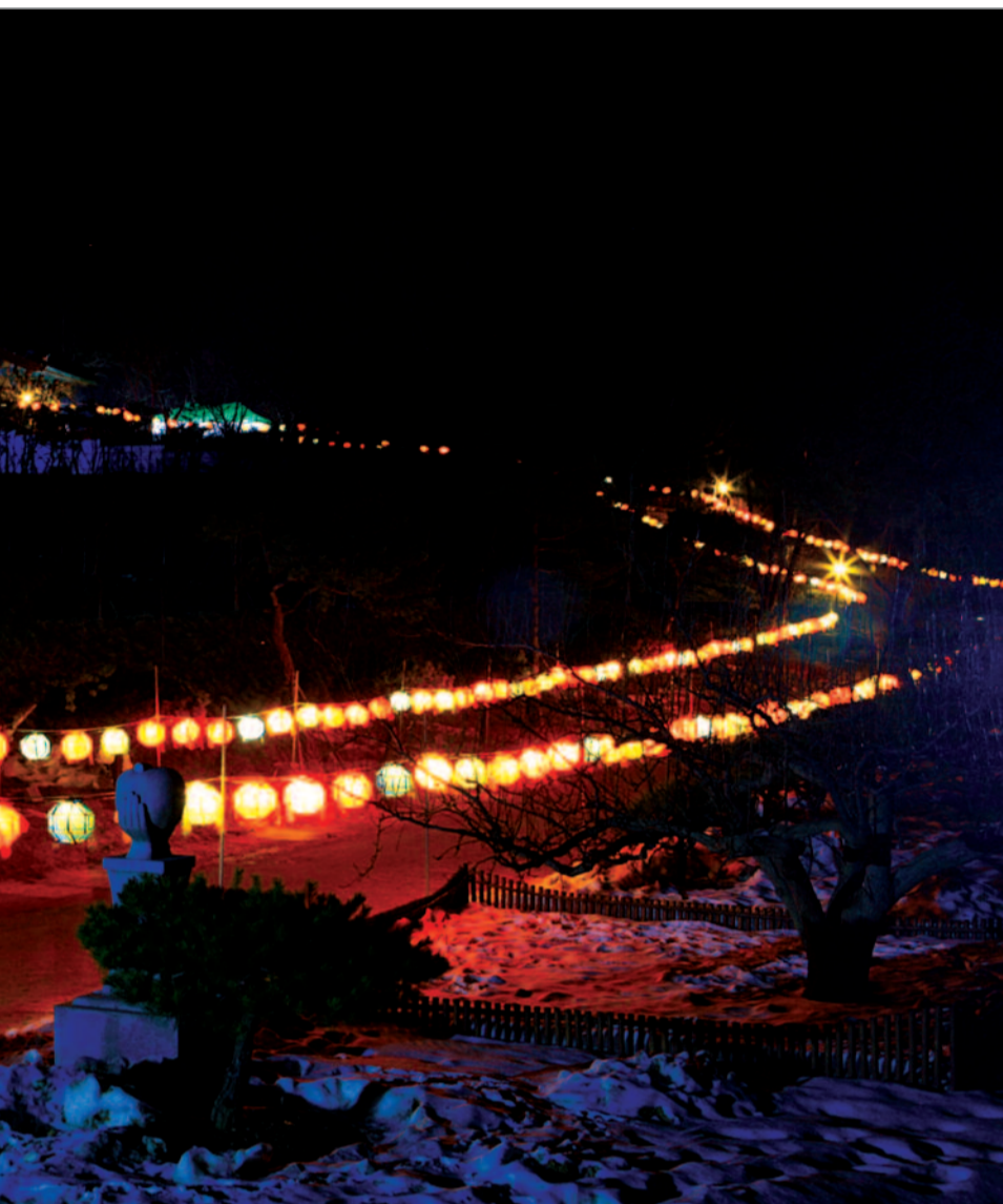
천년 새해도 고즈넉하게 심신의 안식처로 새로운 모습을 선보이고 있다. 새해를 맞아 경내 곳곳에 걸린 연등은 오색찬란한 양양의 연등이 온 누리에 부처님의 지비광명을 전하듯 새해를 맞는 이들에게 감동을 선사했다. 천년고찰 낙산사가 면면히 국민들 식처로 더 많은 역할이 기대된다.