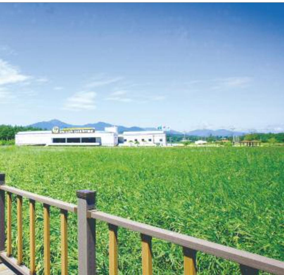
...대 관광객들로부터 인기를 끌고 있다. 우리군은 지난 2007년부터 오산리선사유적박물관 주변 유적지에 움집과 체험장 등 야생동물 관람객들에게 색다른 체험테마를 선사하고 있다. 이로써 지난 2001년부터 총사업비 132억원을 투입해 추진해온 오산리 1.5km, 폭 2m의 습지 탐방 데크로드와 주변의 생태환경을 관찰할 수 있는 조망대, 포토 존, 쉼터 등의 편의시설도 조성돼 피서철을 맞아 유물 등 내부시설을 관람하고 바로 야외 탐방로로 이어지는 탐방 동선이 마련돼 과거 신석기인들이 했던 것처럼 자연과 벗

했다. 살아온 날들이 너무 허무했다. 그 뒤 보 증금 없는 허름한 식당을 서울에 열어놓고 하루 5시간만 자면서 생활비만 간신히 벌었다. 머릿속에서 '어떻게 살아야 후회 없는 삶일까' 하는 질문이 반복적으로 떠올랐다. 여고 시절 문학 전집을 팔며 읽었던 책들, 중학교 입학하며 가졌던 선생님이 되고 싶었던 꿈... 누군가에게 가르치는 일을 하고 싶은 욕구가 점점 커졌다.